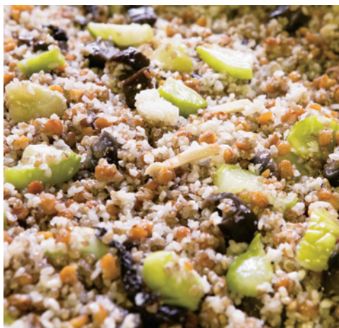
麹をついた大豆、大麦、米を混ぜ合わせたら、塩漬にした野菜を投入。仕込み樽の中がまるで宝石箱のように美しくなる。

径山寺味噌は、味噌というよりも夏野菜の漬物。夏にとれた野菜を冬まで美味しく食べる保存の知恵だ。