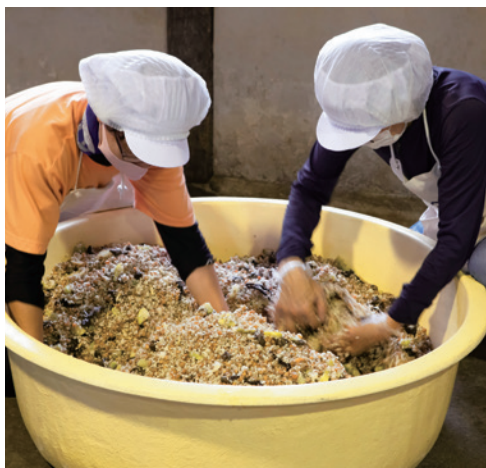
「うちの径山寺味噌は生きている。だから作り方に教科書なんてないんだよ」と主人。女性達が丁寧に手でかき混ぜて均一にする。