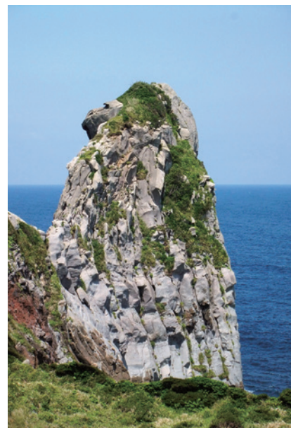
壱岐・黒崎半島の先端にある高さ45mの玄武岩「猿岩」。日本海を望む。