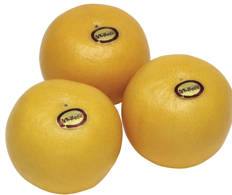
土佐文旦（とさぶんたん）で農林水産大臣賞を2度受賞した『白木果樹園』が食べごろを吟味して直接お届けします。文旦類のなかでも最高峰の温室栽培土佐文旦です。