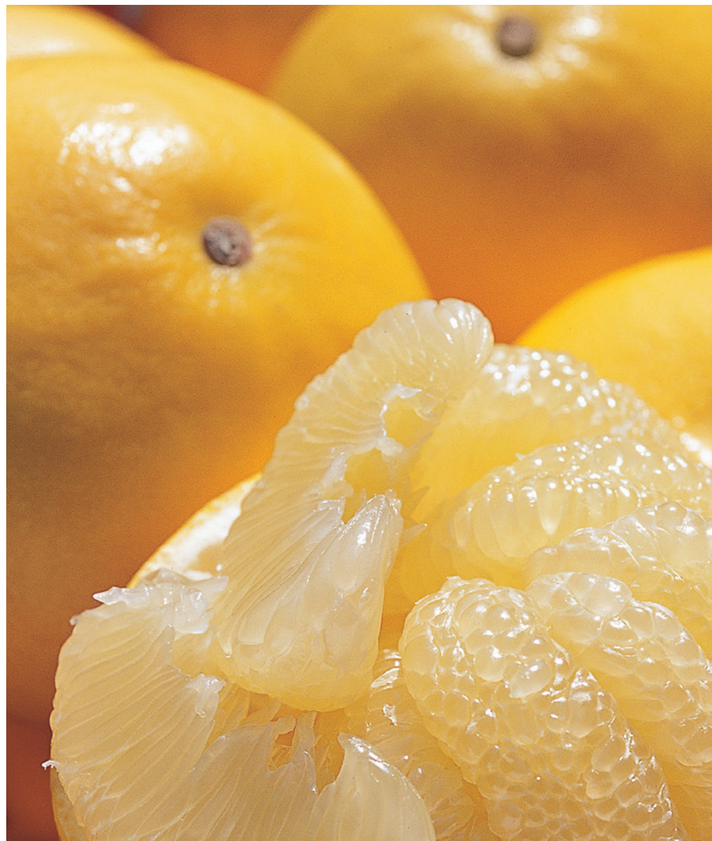
冬から春にかけてが最盛期の土佐文旦。

南国土佐の爽やかでみずみずしく品のいいこの果実を、 発祥の地・宮ノ内地区に訪ねた。