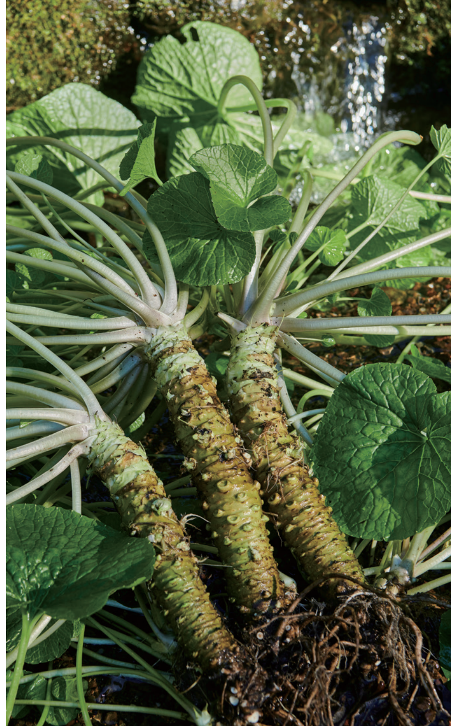
長さ15cmほどある立派なわさびは、ひげ根もたくましい。

清々しい香りや色と鮮烈な辛味。わさびは、ほかに取って代わるものがない、日本が誇る香辛野菜だ。生育は澄んだ湧き水に恵まれた山間部に限られる。抗菌作用や食欲増進などさまざまな効能が謳われるわさびを、栽培発祥の地である安倍川上流に訪ねた。