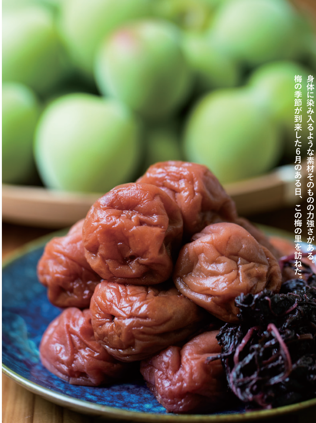
化学肥料を使わずに育てた梅の実を丁寧に漬け込んだ、龍神自然食品センターの梅干し。

身体に染み入るような素材そのものの力強さがある。梅の季節が到来した6月のある日、この梅の里を訪ねた。