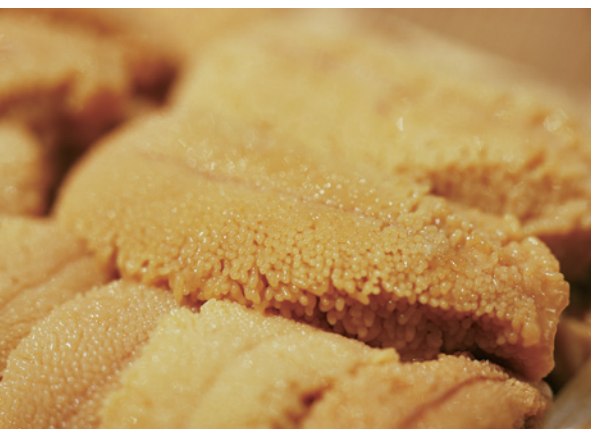
春から初夏にかけて旬を迎えるムラサキウニ。一粒一粒がしっかりとした食感を持っている。