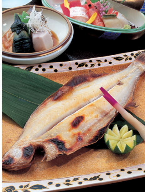
たびたび懐石料理に登場する若狭がれいの塩焼き。程よい干し加減で身が適度に引き締まり、薄塩が独特の甘さを引き出して見事。