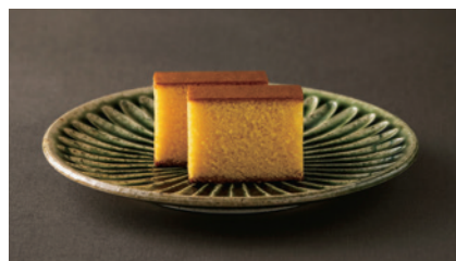
カステラの最高峰と呼ばれる「五三（ごさん）焼」。卵黄と砂糖の量を通常より増やし、その分卵白を減らす。この上なくしっとり濃厚。

「カステラってこんなにおいしいものなんだ、とよく言われます。そんなときは必ず言うんですよ。これは日本一のカステラだよって。手土産に『松翁軒』のカステラを贈るといふ得意客は、そう話す。 カステラの老舗『松翁軒』の初代・山口屋貞助が長崎の本大工町で店を始めたのは、江戸中期の天和元（1681）年。室町時代の終わり頃、交易を求めて長崎港へとやって来たポルトガル人によつて製法が伝えられてから、およそ百年後のことだ。現在つくられているカステラの材料は、卵、砂糖、小麦粉、水飴で、これら4つの配合や生地の合わせ方、焼き方だけで、ふわふわしっとりのカステラが生まれる。