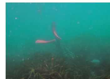
漁は素潜り漁。ウニカギという金具で岩の間などのうにをかき出す。

九州の西端に位置する長崎県は、複雑かつ美しい海岸線をもつ多くの半島と離島からなる。なかでも、陸上のあらゆるものが周りの海の恩恵を受けている長崎を象徴する島が、豊かな山海の幸に恵まれた壱岐だ。 海の王国と言われる長崎県の漁獲高は全国2位。アジア大陸から連なる大陸棚に対馬暖流が注ぎ込み、大小の島々がもたらす複雑な潮流によって多くの魚たちの産卵場となっていて、壱岐ではウニ、サザエ、鮑、鯛など豊富な海の幸が思う存分堪能できる。 壱岐に来たらだれでもがおい