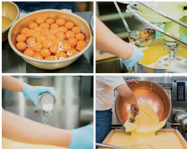
材料は、卵、砂糖、小麦粉、水飴。20代から60代まで十数人の職人が、卵を割ったり、生地を混ぜたり、焼いたり、さまざまな作業を行なっている。