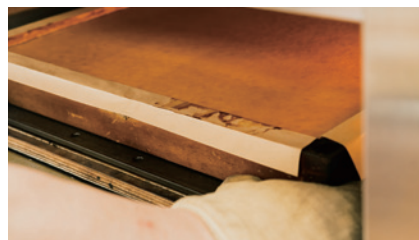
一枚のカステラを一人の職人が焼き上げる。オープンの温度は最高で250°C。夏は暑さとの戦いだという。

●セット内容／五三焼カステラ [400g (10切) × 2] × 2 ●賞味期間／常温 14日 ※パッケージデザインが変更になる場合がございます。