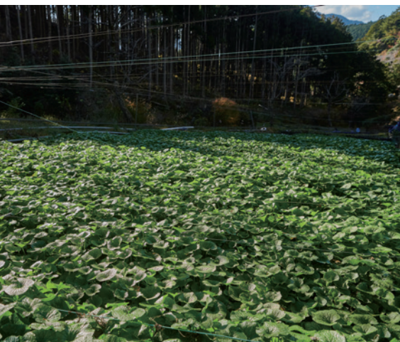
日本最古のわさび産地として有名な有東木の下流に位置する。