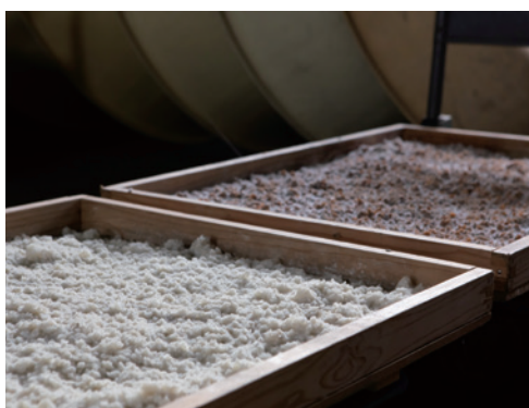
米を蒸して麹をつけたものを麹室に3日ほど入れて発酵させてある。